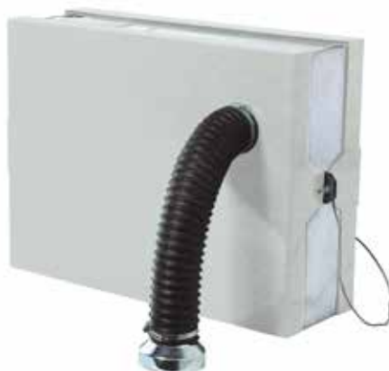
Filtro assoluto in soffiaggio