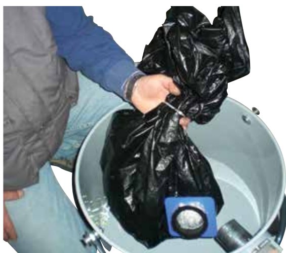
Filtro di sicurezza Safe Bag