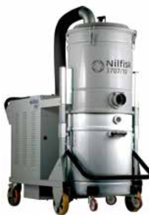
Trifase da 7.5 kW fino a 18.5 kW