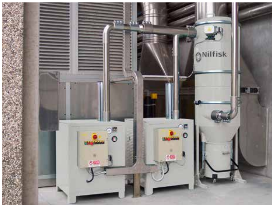
Impianto di aspirazione centralizzato: versione con 2 unità aspiranti ed 1 unità filtrante in azienda chimica

Gli impianti centralizzati sono la soluzione per l'aspirazione, contemporanea in più punti, in ambienti di estesi e con zone che hanno caratteristiche a volte molto diverse. Gli impianti certificati ATEX sono spesso la scelta obbligata per la grande produzione industriale.