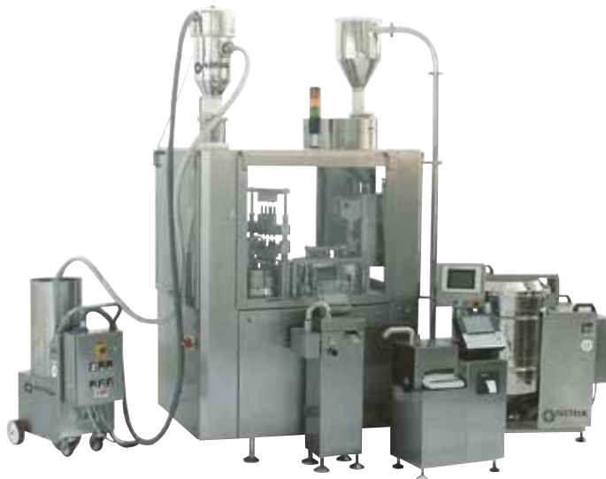
Trasportatore pneumatico (a sx) e spintore per capsule (a dx) su incapsulatrice in azienda farmaceutica.

I trasportatori pneumatici sono progettati per movimentare polveri e granuli da un punto ad un altro senza modificarne la miscelazione. Tipico è l'utilizzo per l'alimentazione di macchine automatiche. Le versioni ATEX sono lo standard di sicurezza utilizzato nelle aree di produzione alimentare e chimico-farmaceutica.