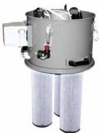
Filtro a cartucce