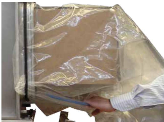
Sistema filtrante Bag-In Bag-Out