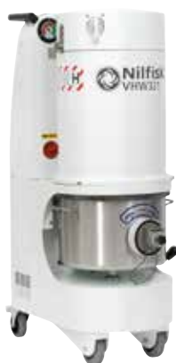
Trifase fino a 4 kW