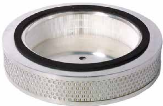
Filtro assoluto in aspirazione

Consulta il sito industrial-vacuum.nilfisk.it per ottenere gratuitamente i cataloghi accessori, optional e separatori: scoprirai la soluzione specifica per le tue esigenze.