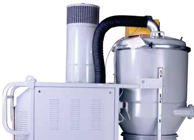
Diffusore per aria di scarico