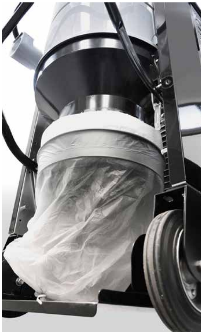
Sistema di scarico "senza fine" Longopac®

Per avere ulteriori informazioni può contattare il servizio clienti 059 9730000. In alternativa può inviare una mail all'indirizzo mercato.italia@nilfisk-advance.com , oppure visiti il sito www.nilfisk.it .