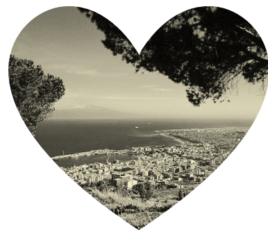
in Reggio Calabria