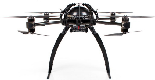
Drone Aeronavics per riprese professionali