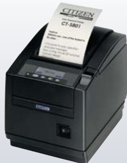
Stampante termica CT-S801