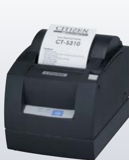
Stampante termica CT-S 310