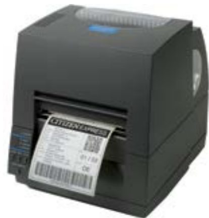
Citizen CL-S 621