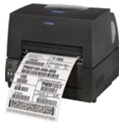
Citizen CL-S 6621