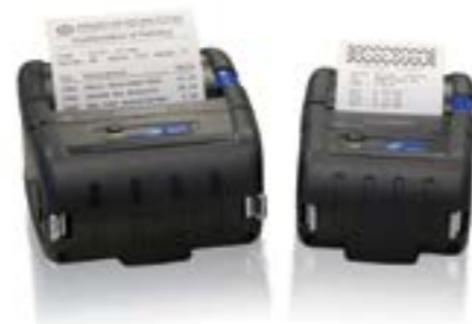
Citizen CMP/20 - CMP/30