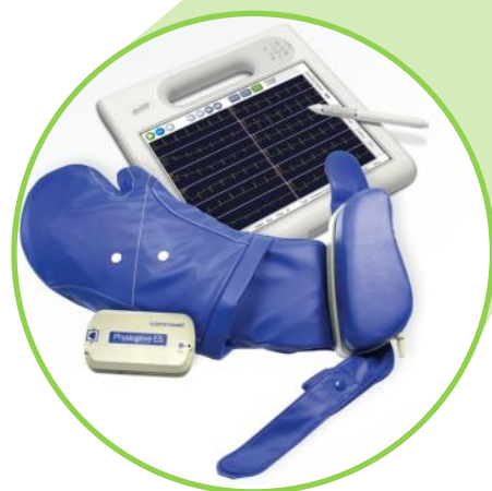
Guanto per ECG