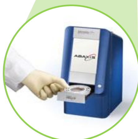
Analizzatore per esami del sangue