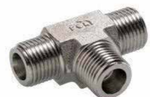
NPT &amp; BSPT