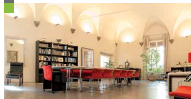
Uffici di Presidenza, Bologna

Abbiamo un team di professionisti giovane ed affiatato, che condivide appieno i nostri valori: correttezza, competenza, efficienza, focus sul cliente. Investiamo continuamente per sviluppare ed aggiornare le competenze dei nostri collaboratori e per cercare soluzioni efficaci per i nostri clienti. Crediamo nei rapporti di lungo periodo costruiti sulla base di fiducia reciproca, affidabilità e coerenza.