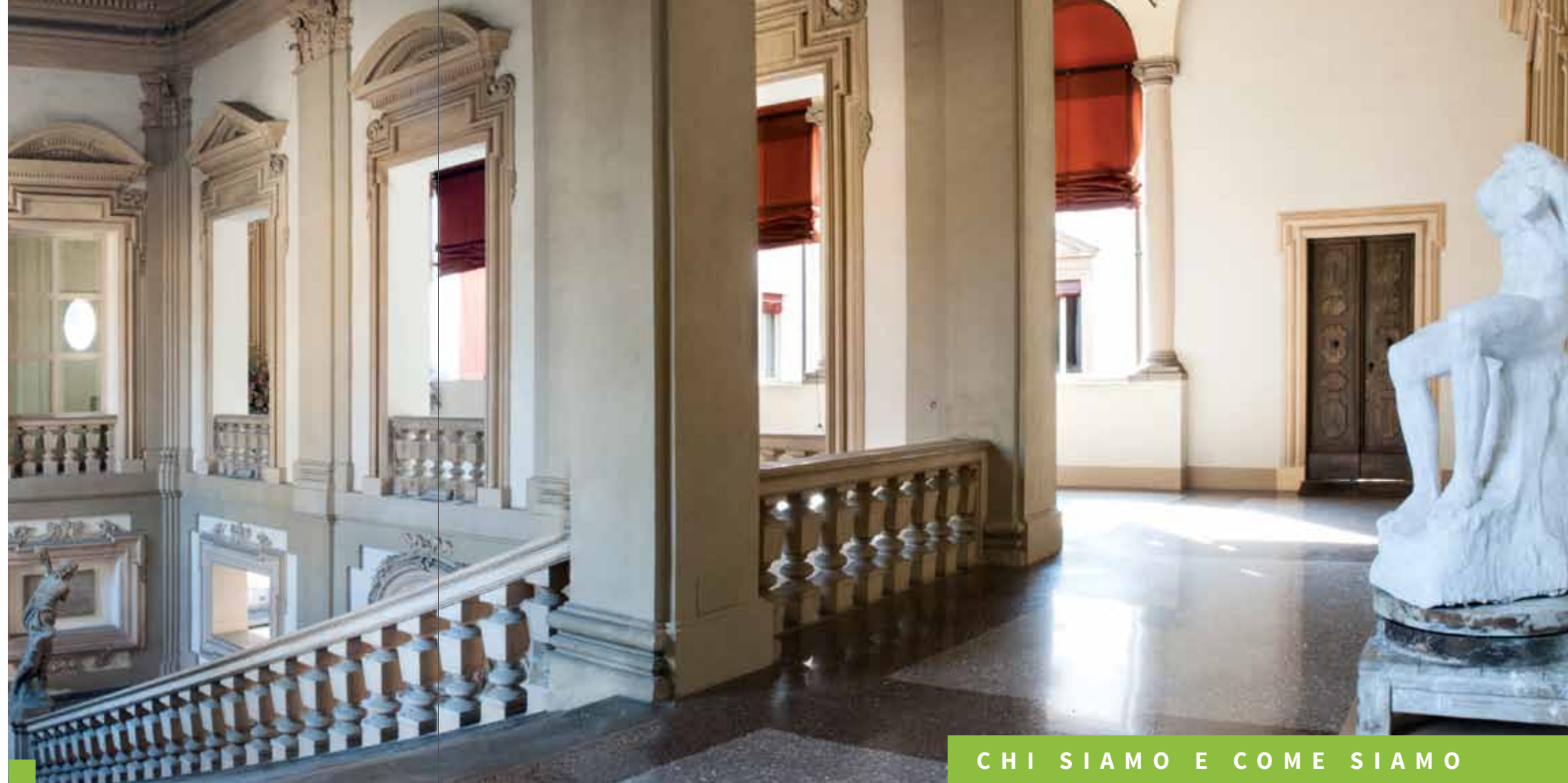
Palazzo Fantuzzi, scalone. Uffici di Presidenza, Bologna