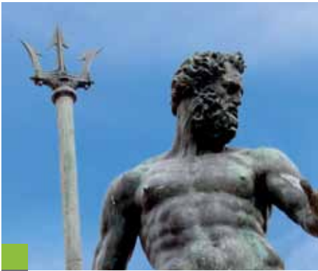
Fontana del Nettuno, Bologna

Guardiamo al futuro, ma siamo orgogliosi del nostro passato. Oltre 100 anni e 4 generazioni di affermati intermediari assicurativi sono una garanzia di serietà ed impegno per la tutela assicurativa dei nostri clienti.