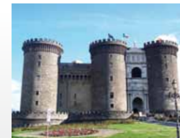
Maschio Angioino Napoli