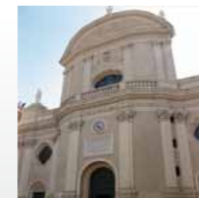
Duomo San Giovanni Battista (Imperia)