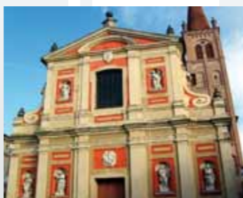
Parrocchia di Sant' Ambrogio Villanova di Castenaso BO