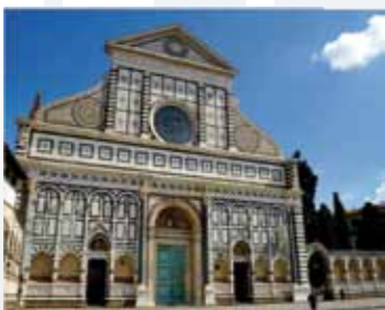
Opera Santa Maria Novella Firenze