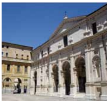
Basilica di Santa Barbara Mantova