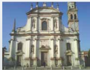
Parrocchia di Crespino Rovigo