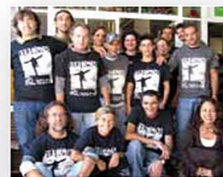
In collaborazione con Cooperativa Etabela