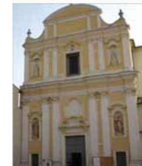
Parrocchia di San Biagio - Cavriana (MN)