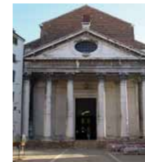
Chiesa dei Tolentini - Venezia