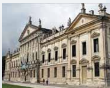
Villa Pisani Stra (VE)