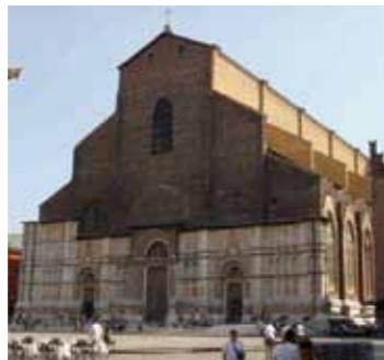
Basilica di San Petronio Bologna