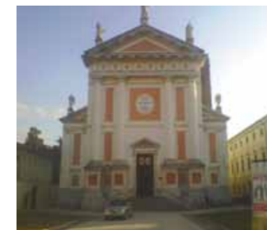
Duomo di Castelfranco Veneto