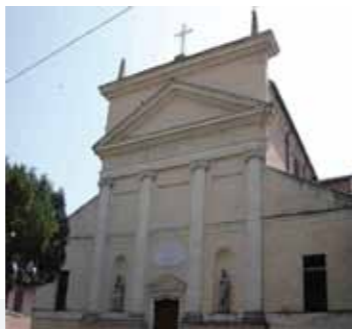
Parrocchia di Oppeano Verona