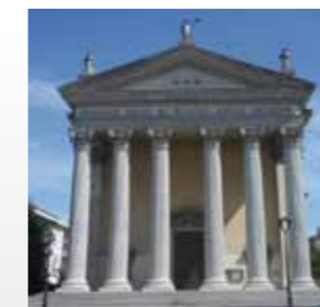
Parrocchia Santa Maria del Rovere - Treviso TV