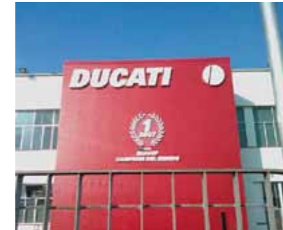
Ducati Motori Bologna