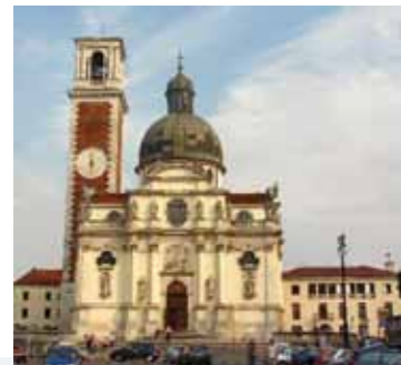
Santuario Monte Berico Rovigo