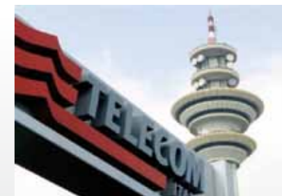
Telecom Italia Sede di Bologna