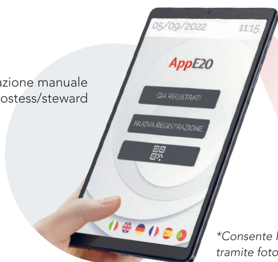
Postazione manuale per hostess/steward

*Consente la lettura QR Code tramite fotocamera posteriore