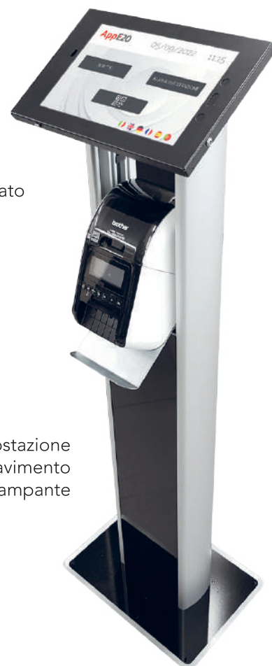
Postazione da pavimento con stampante