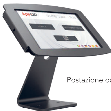
Postazione da tavolo