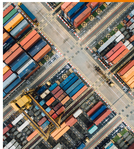
Temporary Export Manager