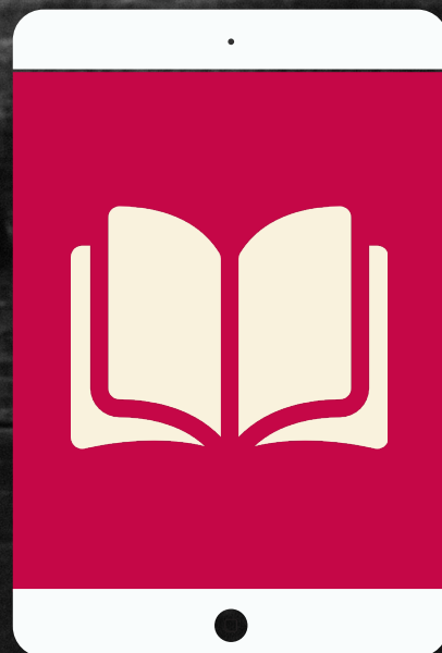
Libro di testo con cd audio per uno studio di tipo tradizionale

Si ispirano a tradizione e innovazione tecnologica, e si adattano a differenti bisogni di apprendimento: