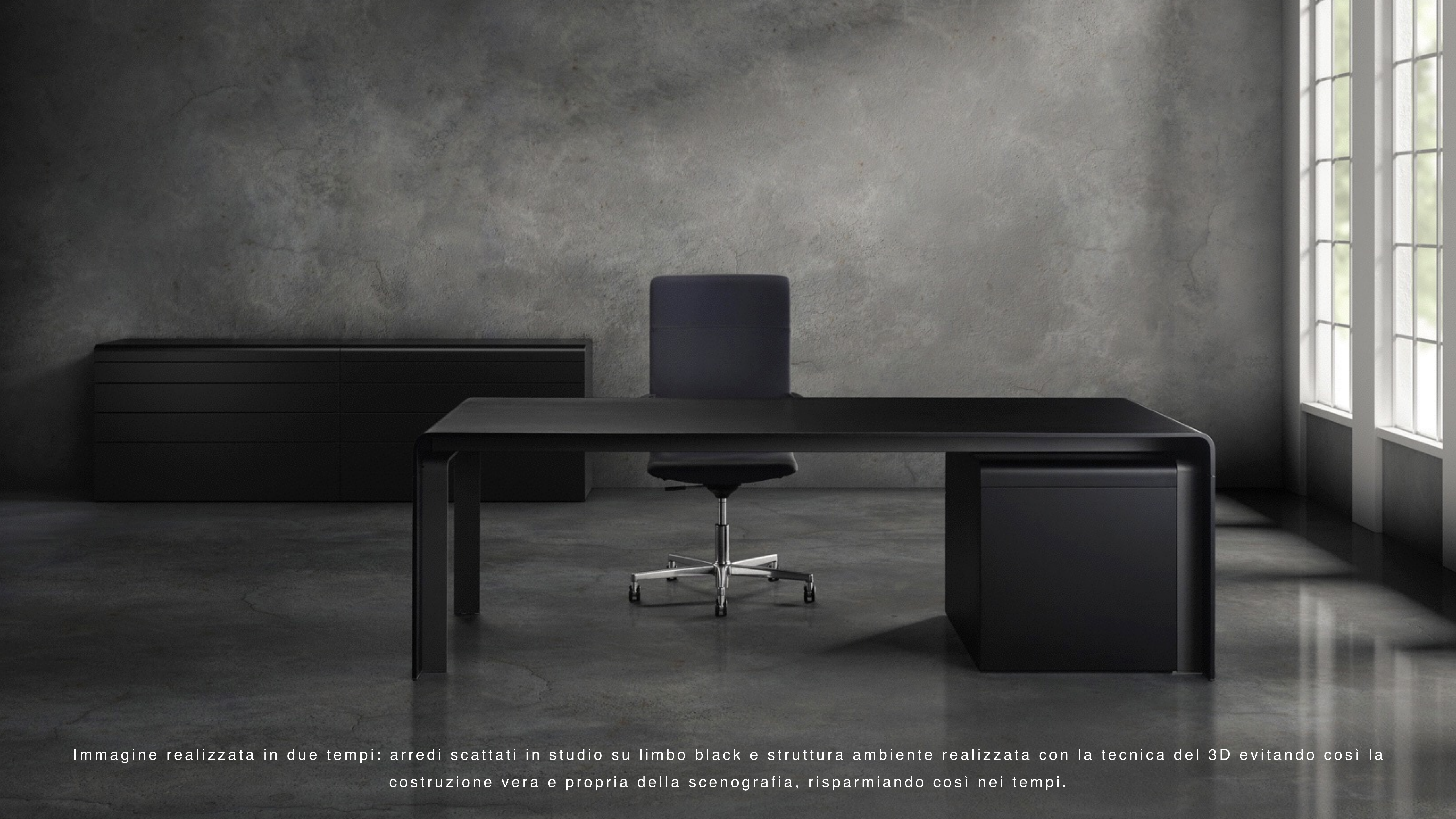
Immagine realizzata in due tempi: arredi scattati in studio su limbo black e struttura ambiente realizzata con la tecnica del 3D evitando così la costruzione vera e propria della scenografia, risparmiando così nei tempi.