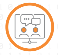
VoIP & Unified Collaboration

Dove c'è un problema, esiste una business unit a tuo supporto. Noi ne abbiamo ben cinque : specializzate, coordinate e pensate per dare risposte puntuali a esigenze complesse. Ogni area è guidata da persone con competenze certificate e una visione chiara : trasformare la tecnologia in uno strumento semplice, efficace e concreto per il tuo business.