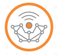
Networking & Wireless Solutions