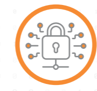
Cyber Security & Ethical Hacking