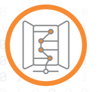
Cabling & Data Center