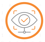
Security & Access Control