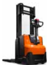
SERIE W SWE080L/100/120(L)(S)(XR)/140(L)(S)/145(L)/160(L)/SWE200(L)(D)

0,8 t / 1 t / 1,2 t / 1,4 t / 1,45 t / 1,6 t / 2,0 t 6,0 m