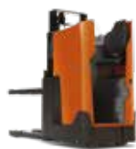
SERIE S SSI200D/SSI160LN

0,75 t / 1,2 t / 1,4 t / 1,6 t / 2,0 t 6,0 m