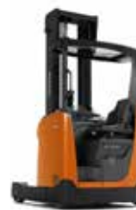
SERIE R RRE140H/160H/180H/200H/250H

1,4 t / 1,6 t / 1,8 t / 2,0 t / 2,5 t 13 m