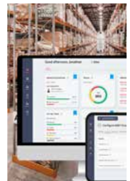
Gestione della flotta