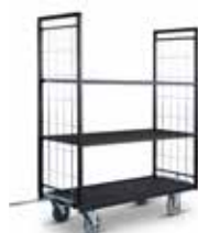
MERCİ SFUSE RIMORCHI PORTAPACCHIA/ PIANALE/A RIPIANI/CON SCALETTA