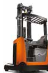
SERIE B RRE120B/140B/160B