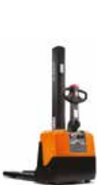
SERIE W HWE100/100S