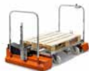
CARICHI PESANTI TAXI/RIMORCHI TAXI A PORTALE/ RIMORCHI CON PIANALE