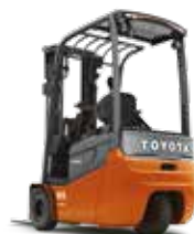
TRAIIGO 24 8FBEST10/13/15