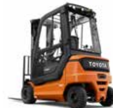
TRAIIGO 48 9FBE15T/16T/18T/20T 9FBEK16T/18T 9FB16T/18T/20T 9FBK16T/20T

1,5 t / 1,6 t / 1,8 t / 2,0 t fino a 750 Ah (piombo-acido) fino a 630 Ah (Li-ion)