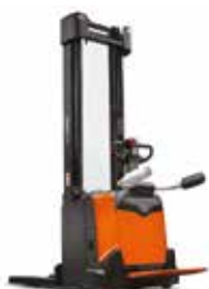
SERIE P SPE120(L)(XR)(XRD)/140(L)(S)/160(L)/200(L)(D)(DN)

0,8 t / 1 t / 1,2 t / 1,4 t / 1,45 t / 1,6 t / 2,0 t 6,0 m