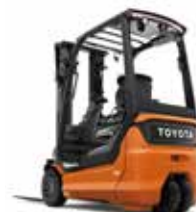
TRAIIGO 48 60-9FBEK16T 60-9FBE20T 60-9FB20T