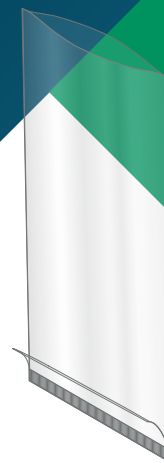
BUSTA PIATTA TERMOSALDATA CON FONDO RISVOLTATO (BP)