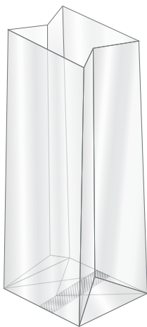
SACCHETTO A FONDO QUADRO CON FONDO SALDATO (SFQTS)