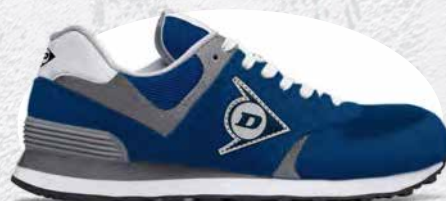
BLUE NAVY · BLUE NAVY · BLEU MARINE 0203005