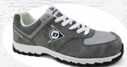
GRIGIO · GREY · GRIS 0201017