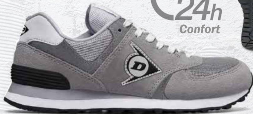
GRIGIO · GREY · GRIS 0203003