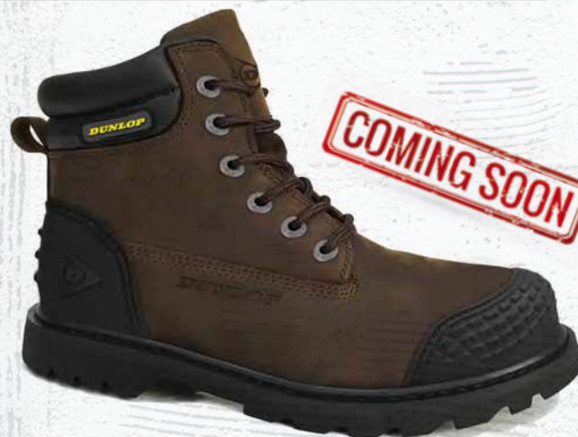
MARRONE · BROWN · MARRON