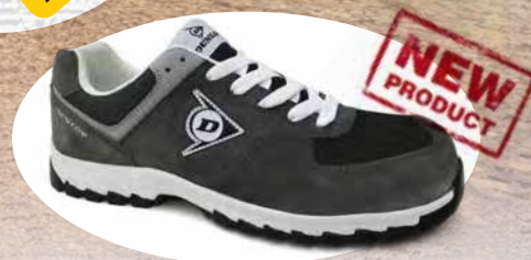
CARBONE · CHARCOAL · CHARBON 0201040