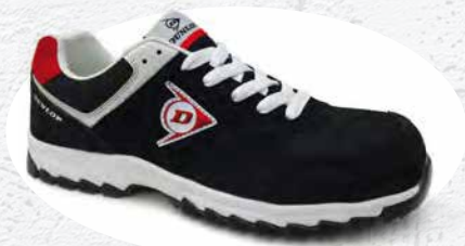
NERO/ROSSO · BLACK/RED · NOIR/ROUGE 0201018