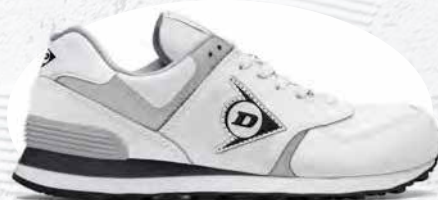
BIANCO · WHITE · BLANC 0203002