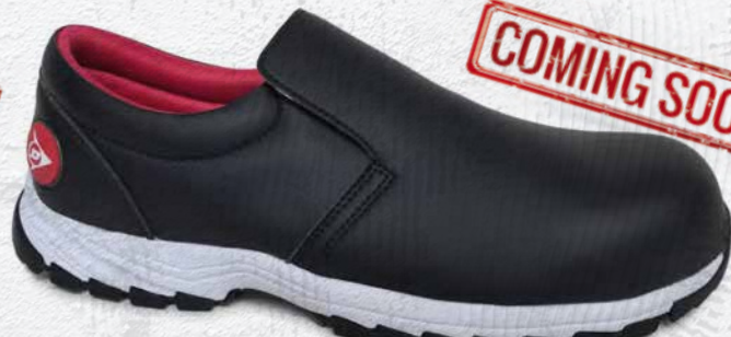
NERO · BLACK · NOIR