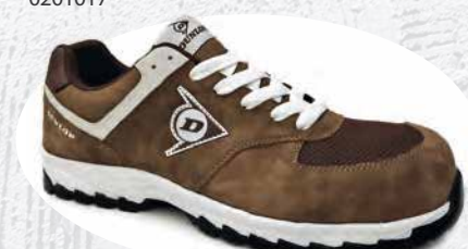
MARRONE · BROWN · MARRON 0201027