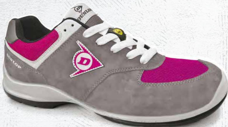
GRIGIO/ROSA · GREY/PINK · GRIS/ROSE 0201024