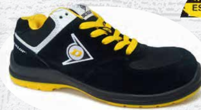
GIALLO · YELLOW · JAUNE 0201038