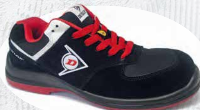
ROSSO · RED · ROUGE 0201037