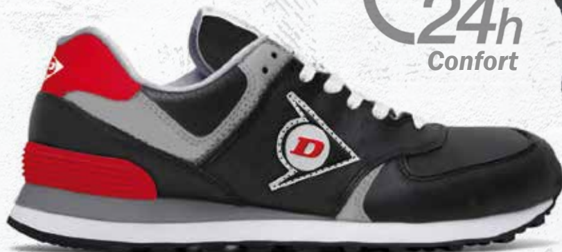
NERO · BLACK · NOIR 0203001