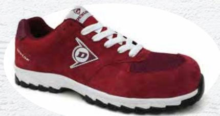
ROSSO · RED · ROUGE 0201016