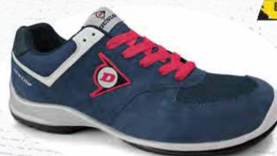
BLUE/ROSA · BLUE/PINK · BLEU/ROSE 0201025