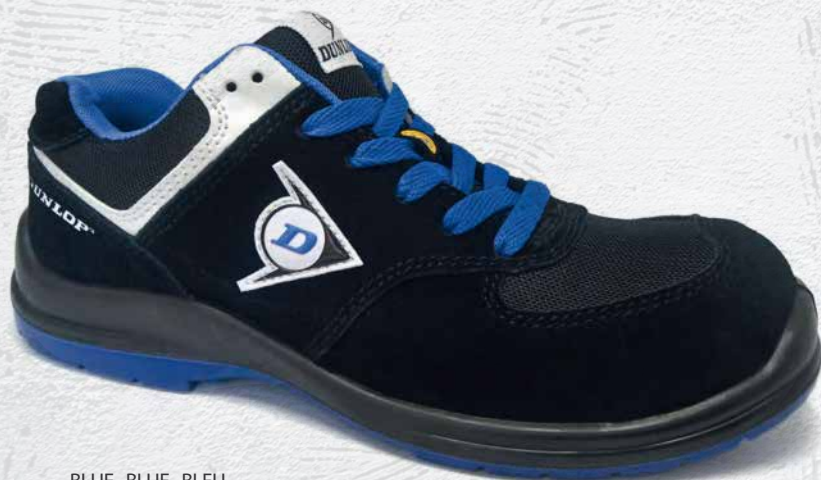
BLUE · BLUE · BLEU 0201036

FR - Ligne de chaussures de sécurité pour femmes en cuir velours et textile S3. Coque en composite. Semelle intérieure en tissu anti-perforation sans-métal, Semelle en PU double densité + ESD + SRC.