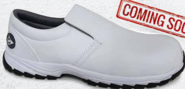
BIANCO · WHITE · BLANC

FR - Chaussures en cuir nubuck, S3, fabriquées avec des matériaux de haute qualité. Embout composite. Modèle textile anti-perforation. Triple couture goodyear. Protections en caoutchouc supplémentaires au talon et à la pointe. Semelle robuste pour une meilleure adhérence.