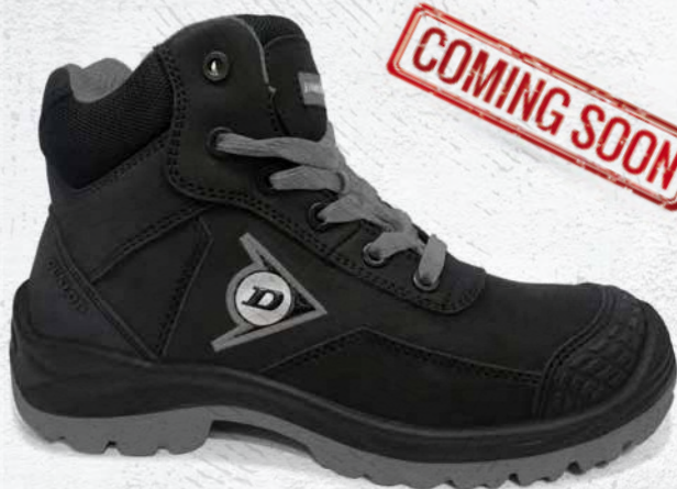
NERO · BLACK · NOIR