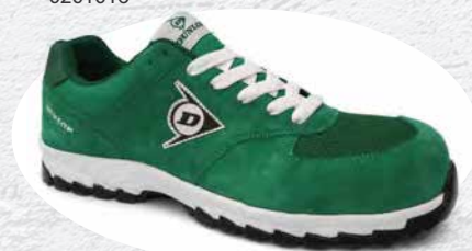
VERDE · GREEN · VERT 0201019