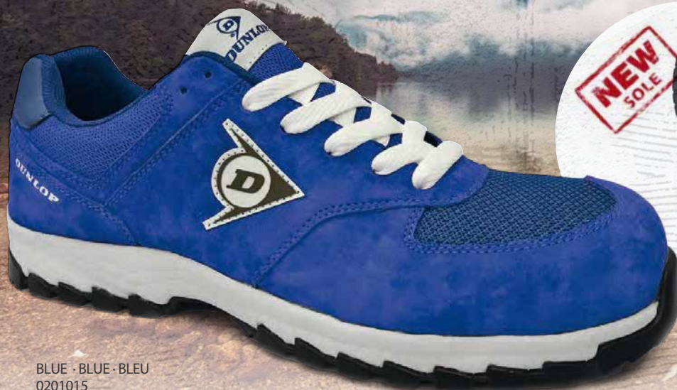
BLUE · BLUE · BLEU 0201015