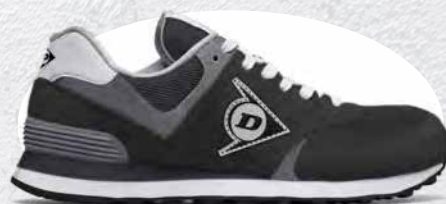
CARBONE · CHARCOAL · CHARBON 0203004