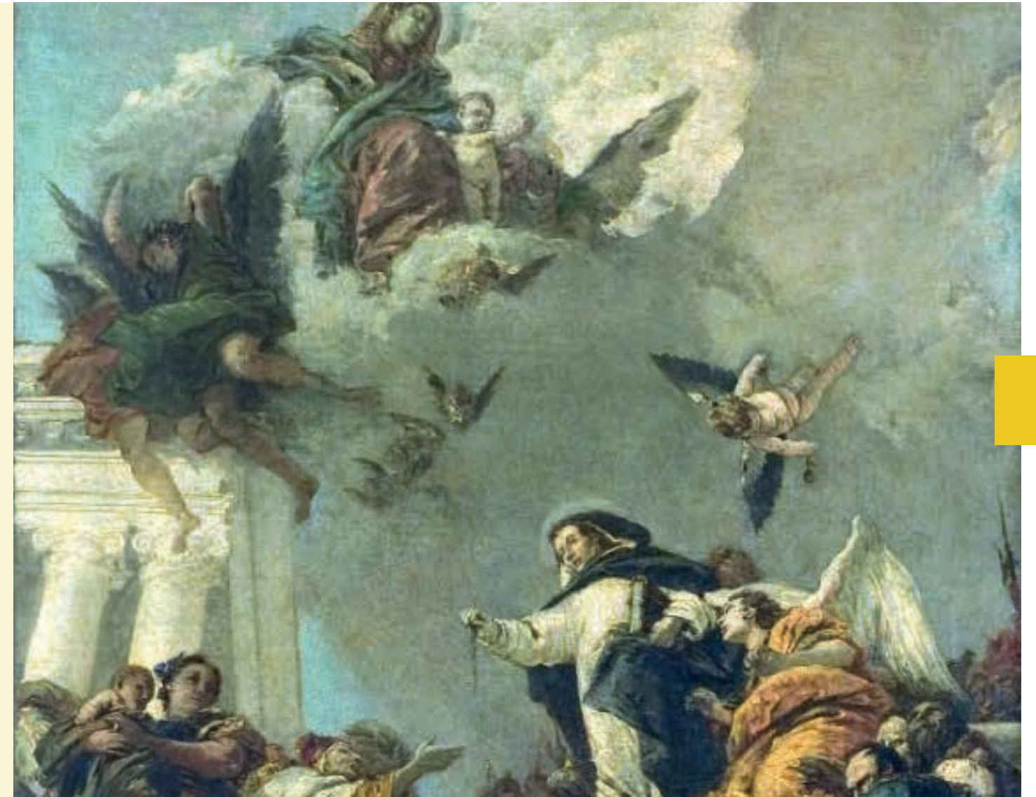
San Domenico che istituisce il Rosario - Gianbattista Tiepolo

In collaborazione con altre imprese napoletane, Tecno si è distinta nell'operazione di fundraising che ha visto l'acquisto dei preziosi tappeti Harlequin, pavimento innovativo da danza ammortizzante, destinato alle sale ballo e palcoscenico del Real Teatro San Carlo.